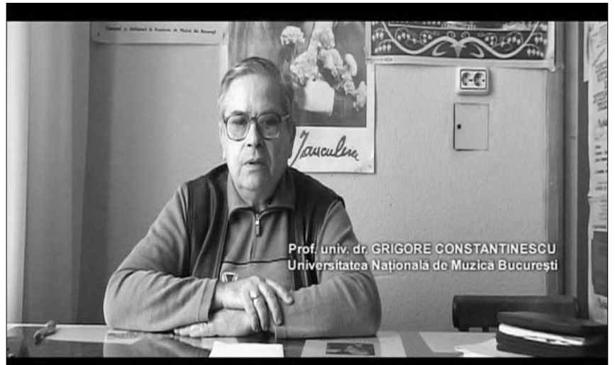
Imagini din filmul realizat de Manuel Pelmuș

Cea mai importantă calitate a studiului realizat de Manuel Pelmuș este baza