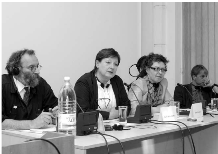
Imagine de la conferința și prezentarea proiectului la Biblioteca Centrală Universitară Carol I – Galeria „Galateca” - 20 aprilie 2007

Prin urmare, ieșirea din această logică a conjuncturii depinde în mare măsură de acceptarea dimensiunii publice a artei ca practică discursivă distinctă în procesul de formare a conștiinței publice. Este nevoie de proiecte specifice, care să susțină prezența activă a artei în spațiul public, asigurîndu-i vizibilitatea și lărgirea audienței. Practicile culturale curente ne confirmă că acest scenariu este „în construcție” și va mai dura pînă cînd fenomenul artistic contemporan va cîștiga recunoașterea firească în peisajul societății. Totul depinde de capacitatea noastră de a valorifica, în avantajul nostru, decalajul temporal moștenit și de reușita cu care instituția publică se va impune drept o structură reglatoare, credibilă în dinamica scenei culturale românești.