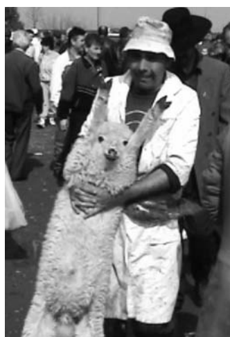
Mircea Cantor – Tăcerea Mielilor/The Silence of the Lambs 1998-2003. Cadru din film

Fără a se cunoaște exact originea lor, statuile vivante fac astăzi parte din peisajul turistic obișnuit și se adaugă de obicei moștenirii culturale pe care fiecare metropolă și-o valorifică. De la mimi lucrînd ca „freelanceri“ în centrele întesate de turiști și acceptînd o plată în schimbul unei fotografii, pînă la performerii care participă în festivaluri de gen și în expoziții de artă, statuile vivante fac dovada unei măiestrii a detaliului și unei integrări perfecte în spectacolul cotidian. Monument (Istorie/Isterie 2) , proiectul lui Dan Perjovschi, folosește însă această formă binecunoscută pentru a resuscita memoria recentă a spațiului public românesc. Un spațiu public care nu este definit de utilizarea patrimoniului drept capital turistic sau de folosirea străzii drept spațiu de intervenție creativă, ci de violență, agresiune, intoleranță, zgomot excesiv și incapacitate de a-și asuma democrația ca și coexistență civilizată. În acest sens, Dan Perjovschi reamintește, într-o manieră tăcută, însă directă, momentul încă discutat și disputat, momentul de isterie colectivă și manipulare brută al mineradelor din anii '90. Minerul și studentul care vor putea fi înțelși drept statuie vie timp de o săptămînă în Piața Universității din București reprezintă astfel un antimonument, amintînd necesitatea asumării responsabilității comune pentru istoria pe care cu toții am construit-o.