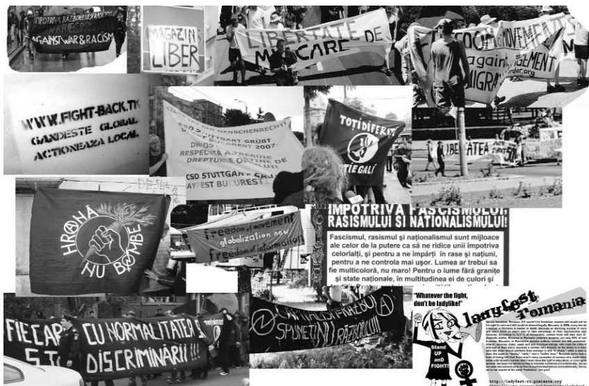
H.arta – Inițiativă. Foto-colaj, 2007

Un alt proiect care lucrează în mare măsură cu teme legate de intoleranță este acela coordonat de grupul H.arta. Cele trei artiste au pregătit un spațiu de proiecte cu un program zilnic timp de o lună, care va funcționa atât ca un info point pentru întreg proiectul Spațiul Public București / Public Art Bucharest 2007 – unde publicul poate accesa informații despre proiect și despre artiștii participanți sau poate consulta publicațiile proiectului –, cât și un proiect artistic în sine. Spațiul de proiecte (Project Space) este structurat pe 4 teme: postcomunism, feminism, educație și display, pentru dezbateră fiecareia dintre acestea fiind invitați participanți din diferite zone culturale sau sociale, majoritatea reprezentând inițiative din zona independentă, care au drept scop combaterea prejudecăților și crearea de noi formate ale gândirii față de celălalt în spațiul public românesc.