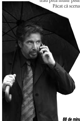
88 de minute/ 88 Minutes, 2006, regia Jon Avnet, cu: Al Pacino, Leelee Sobieski, Deborah-Kara Unger

Altfel, nimic nou în acest thriller în care un psiholog e confruntat cu o serie de crime efectuate în același mod cu cele ale psihopatului aruncat de el în pușcărie. Scenariul pleacă în mai multe direcții, nehotărît, pentru că la final să se oprească la un vinovat spre care nu trimiteau prea multe piste. Păcat că scena-