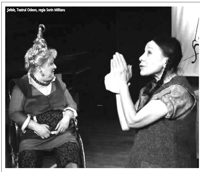
Șefe, Teatrul Odeon, regia Sorin Militaru

În Ungaria, banii care se bagă în teatru sînt urmăriți pînă la final, adică nu poți să cheltuești bani fără să răspunzi pentru felul în care îi distribuie. Valoarea unui teatru se cuantifică în funcție de turnee, încasări, număr de spectatori și, dacă îmi spui că așa e și la noi, atunci eu îți zic că așa pare că e. În Ungaria, un director care cîștigă un concurs are libertate totală, poate schimba întreaga structură a unui teatru, nu i se pun piedici. Am lucrat mult mai bine la Budapesta decît în România. Discuțiile despre buget sînt absolut transparente. Ți se oferă un buget din start în care trebuie să te încadrezi. Știi cîți bani ai de cheltuit de la început și în funcție de asta îți trasezi anumite limite. În cazul în care rămîn bani necheltuiți, se duc înapoi la primărie. Munca din teatru nu e încurcată de telenovele sau de alte activități. Totul e programat pînă în ultima secundă a timpului de lucru și, cînd semnezi contractul, știi clar ziua