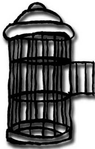
Kurt Vonnegut, Jr. 1922 – 2007