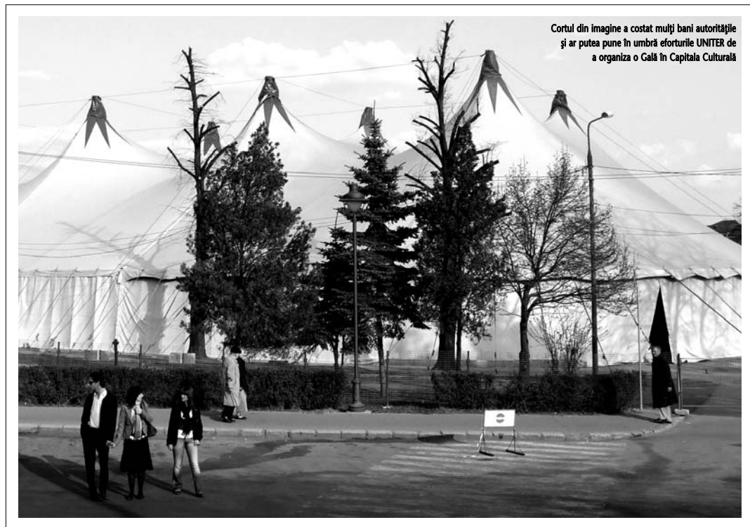
Cortul din imagine a costat mulți bani autoritățile și ar putea pune în umbră eforturile UNITER de a organiza o Gală în Capitala Culturală

În Sibiu devenit Capitală Culturală Europeană pentru un an, lipsa unei săli mari de spectacole este cu siguranță o mare problemă. A fost cunoscută încă de cînd orașul își depunea candidatura, în 2004, iar rezolvarea s-a căutat în închirierea cortului multifuncțional, ce a costat 800.000 de euro. Lipsa unei săli adecvate a stat la baza celor două scanda-