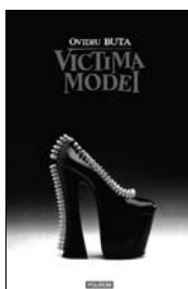
Ovidiu Buta, Victima modei , Hors collection, Editura Polirom, 288 de pagini, 24.90 RON

Volumul de debut al lui Ovidiu Buta, cel mai cunoscut jurnalist de modă din România.