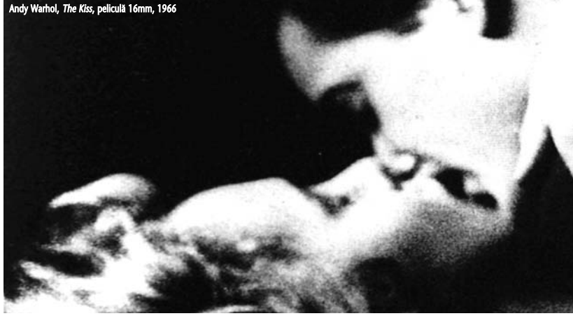
Andy Warhol, The Kiss , peliculă 16mm, 1966