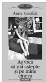
Anna Gavalda, Aș vrea să mă aștepte și pe mine cineva , traducere din limba franceză de Raluca Baciu, colecția „Biblioteca Polirom”, Editura Polirom, 232 de pagini, 18.50 RON

Victima modei inițiază o incursiune în culisele modei românești și internaționale, dezvăluind mecanismele atât de controversate, dar exacte ale modei. Gafe vestimentare, „fauturi” artistice, săptămîni ale modei, colecții mai mult sau mai puțin reușite, toate sînt surprinse și disecate – de multe ori, cu o ironie neîndurătoare – în acest volum de debut al celui mai cunoscut jurnalist de modă din România.