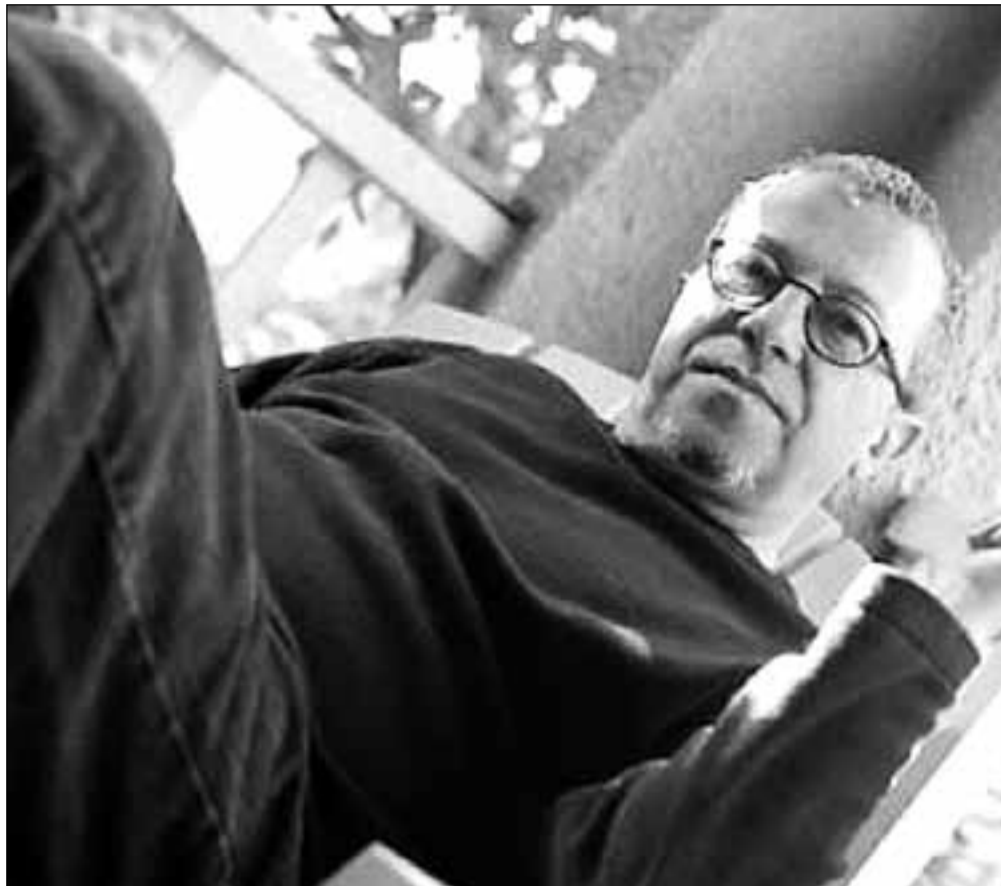
Andrei Codrescu „i-a scris” lui Casanova memoriile din ultimii săi ani de viață

cea care: „I-a lăsat doar cîteva cuvinte incrustate cu inelul cu diamant pe geam. Tu oublieras Henriette, aussi. O s-o uiti și pe Henriette. N-a uitat-o nicicînd ”. Pentru că scriitorul a intuit exact: cuceritorul adevărat nu este un împănat ridicol și agresiv, ci bărbatul-prieten, cel cu care aceste femei extraordinare „își deschideau inimile și discutau despre tot felul de lucruri, oricît de banale sau aparent artificiale”. Iar extazul, culmea extazului era atînsă, cîteodată, nu prin cine știe ce artificii vicioase, ci după o discuție despre arta literară a unor confrăți ca Voltaire sau Goethe.