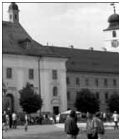
Sibiu, Piața Mare

În primul rînd, a fost vorba despre decizia de politică locală a Primăriei Sibiului, care a reușit să-și asume această provocare. Apoi, susținerea candidaturii prin Ministerul Culturii și Cultelor, la începutul anului 2004. Ca urmare a evaluării, s-a ajuns la această decizie. Primarul Sibiului, Klaus Werner Johannis, recunoaște că ei au fost nevoiți să lucreze într-un timp foarte scurt pentru a satisface cererile dosarului. Sibiuul are ceea ce-i trebuie pentru a fi un loc al valorilor și culturii europene. O problemă o reprezintă instituțiile care să pună în evidență la scară europeană valorile orașului. Problema pe care și-o pune orice evaluator european pentru o capitală culturală este capacitatea de a comunica faptul că deține valori europene, capacitatea de a-i primi pe cei care vor să cunoască orașul, capacitatea de a se exprima prin diverse canale de comunicare. Asta include o campanie de promovare a valorilor Sibiului, identitatea vizuală a proiectului, marketingul orașului.