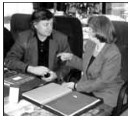
Ion Caramitru și Mona Muscă au multe planuri în comun