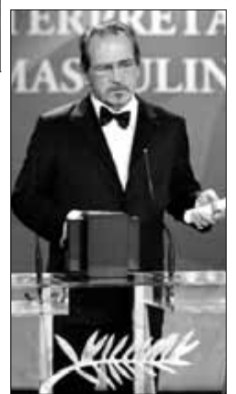
Tommy Lee Jones

În 1984, obținuse premiul Camera d’Or, iar în 1993, a plecat de la Cannes cu Palme d’Or pentru scurtmetrajul Somewhere in California , din seria Coffee and Cigarettes . De data aceasta, pelicula sa Broken Flowers a obținut Marele Premiu. Jarmusch s-a arătat mîndru de distincția primită, chiar dacă declarase că nu crede în „concuranță la nivelul expresiei artistice”.