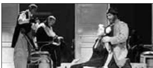
Imagini din spectacolul Othello?! , regizat de Andryi Zholdak