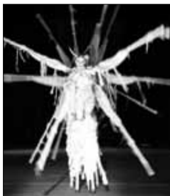
Star trek – generația străzii

Zholdak a arătat mai bine decît oricine cum poate fi redat pe scenă un sentiment atunci cînd, forțat de jurnaliști, regizorul a trebuit să explice amputarea piciorului Desdemonei în Othello?! . Trecînd printr-un