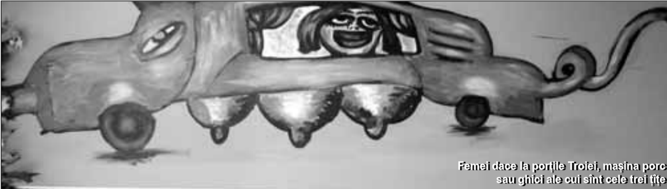
Femei dace la porțile Troiei, mașina porc sau ghioci ale cui sînt cele trei țife