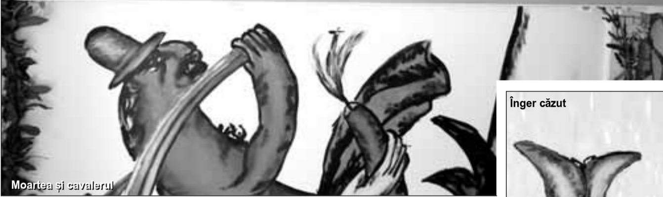
Moartea și cavalerul