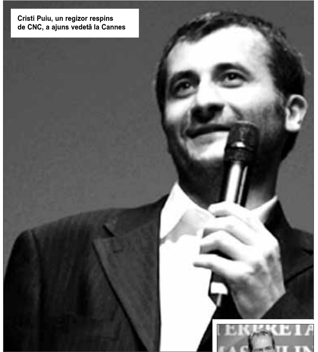
Cristi Puiu, un regizor respins de CNC, a ajuns vedetă la Cannes