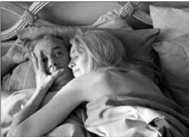
Filmul regizorului american Jim Jarmusch Broken Flowers a fost recompensat cu Marele Premiu

Un alt câștigător al acestei ediții a Festivalului de la Cannes a fost americanul Jim Jarmusch.