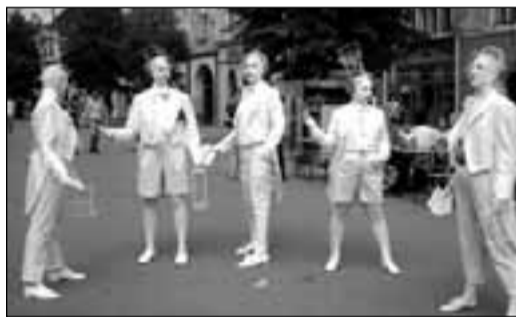
Compania Art&Shock, evoluînd la Sibiu