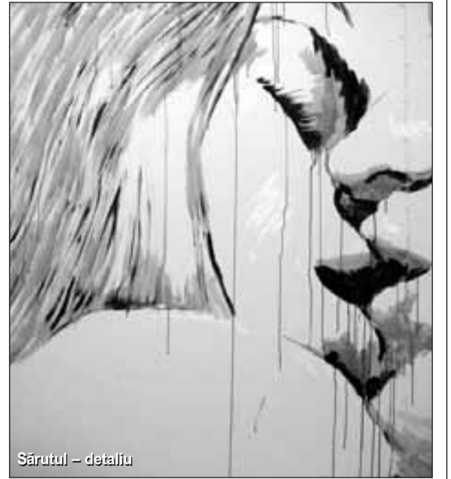
Sărutul – detaliu

E normal ca specialiștii în semiotică să mă catalogheze astfel, de la ei mă așteptam la asta. Pentru că e o formă la care am lucrat multă vreme și intenționat n-avea nici o legătură cu nimic. Oamenii cînd nu înțeleg ceva spun dracul, Satana, hai să fugim. M-am jucat și mă așteptam la o asemenea reacție, dar a celor de pe stradă... Să apar la un post de televiziune nu mă așteptam, e drept. A fost o surpriză plăcută, să știți.