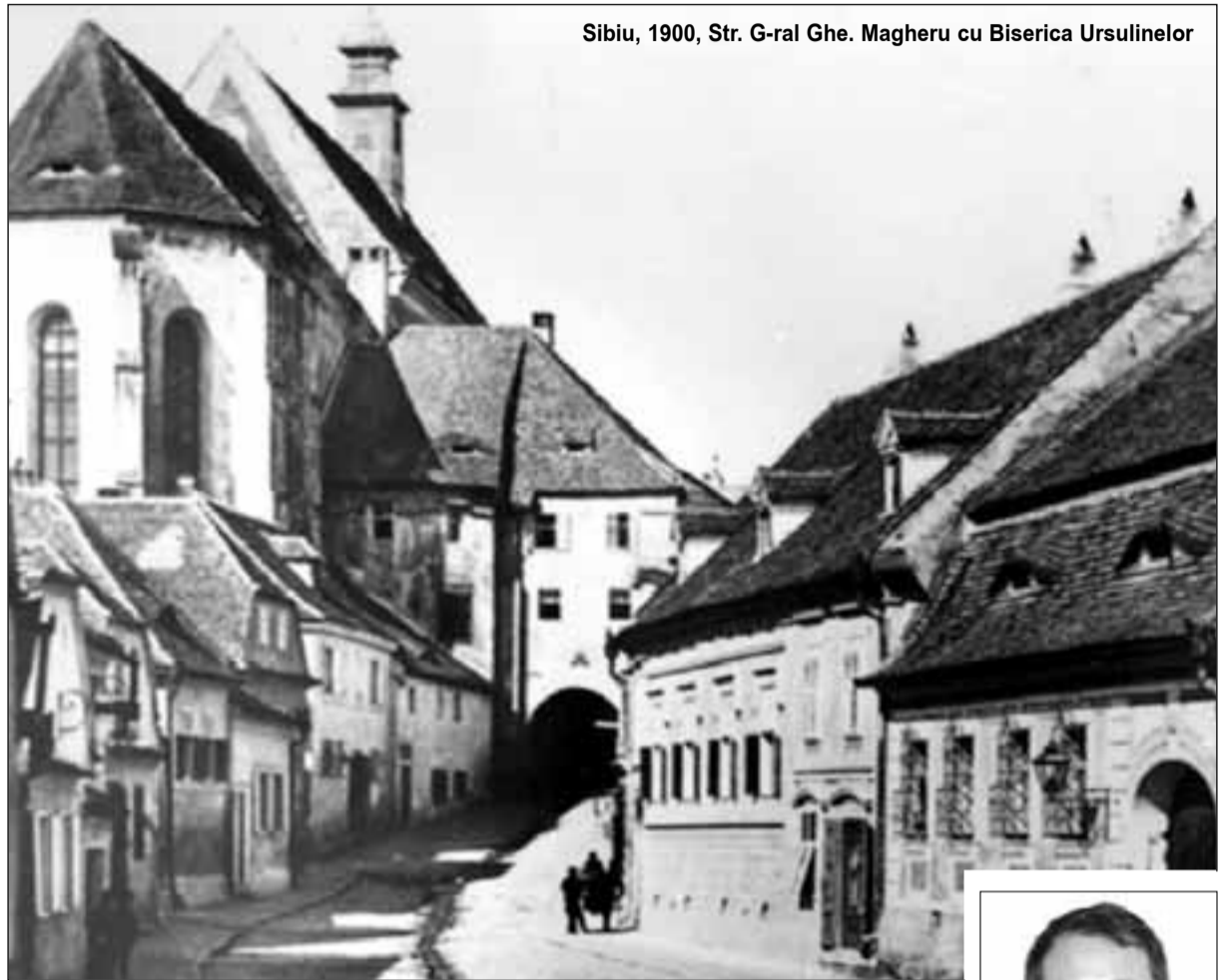
Sibiu, 1900, Str. G-ral Ghe. Magheru cu Biserica Ursulinelor

Avem 300 de aplicații depuse. Nu vor fi toate selectate. Procesul de selecție va avea un rezultat de evaluare culturală, în urma căruia un juriu de experți va spune că se poate pune eticheta „Sibiu 2007” pe un proiect. Este vorba despre oameni care sînt cei mai cunoscuți în domeniul lor. Evaluarea culturală nu are numai un caracter local. Avem deja stabilit un juriu central ce a definit criteriile în funcție de care juriile specializate, formate din cîte trei reprezentanți pentru fiecare domeniu, le vor pune în aplicare la selecția finală. Au răspuns invitației noastre Horia-Roman Patapievic, Ion Carami-