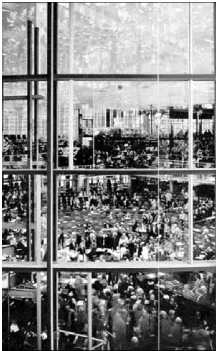
Andreas Gursky – Bundestag, 1998, fotografie color, 285X210 cm

Gursky explorează relația dintre oameni și structurile organizaționale ale mediului creat de aceștia. Fie că reprezintă arhitecturi anonime, spații publice populate, fotografiile sînt pentru artist „imagini rememorate”, o bancă de informații distilate în simboluri ale civilizației occidentale. Într-una dintre declarațiile sale, artistul afirmă că „există un limbaj comun al subconștientului inteligibil pentru toți oamenii”. Fotografiile sale poartă acea informație care prin adevărul său implicit este accesibilă tuturor. Poate că acesta este și secretul popularității sale.